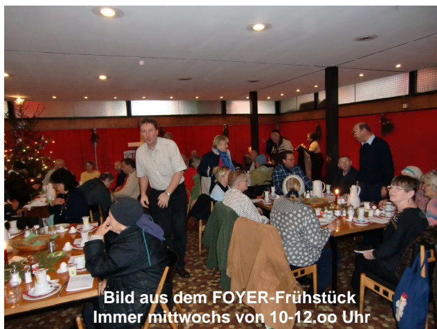
Bild aus dem FOYER-Frühstück Immer mittwochs von 10-12.00 Uhr

Die Kirche für Neugierige (ein Kurs zum Glauben über die grundlegenden Fragen des christlichen Glaubens) findet mittlerweile zum 9. Mal im FOYER statt. Seit Ende Oktober ist eine neue Runde angelaufen, die bis Dezember bzw. vielleicht auch Januar laufen wird. 3 Frauen und 6 Männer (!) informieren sich über Inhalte des